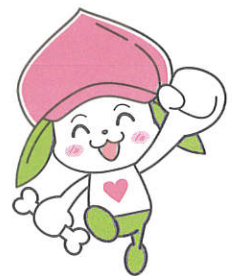
協会けんぽ福島支部マスコットキャラクター ケンタくん